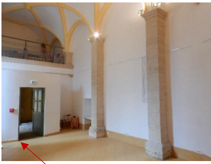
Entrée de la chapelle