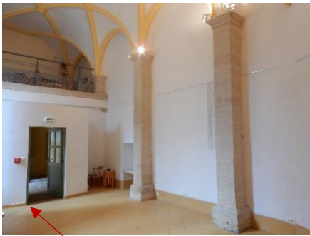
Entrée de la chapelle